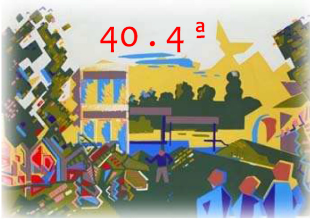
Los cuarenta de la cuarta By Rafa Jiménez Ambel